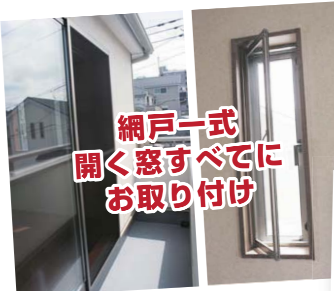
網戸一式 開く窓すべてに お取り付け