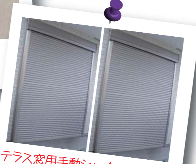
テラス窓用手动シャッターが2台! (1Fのみ)