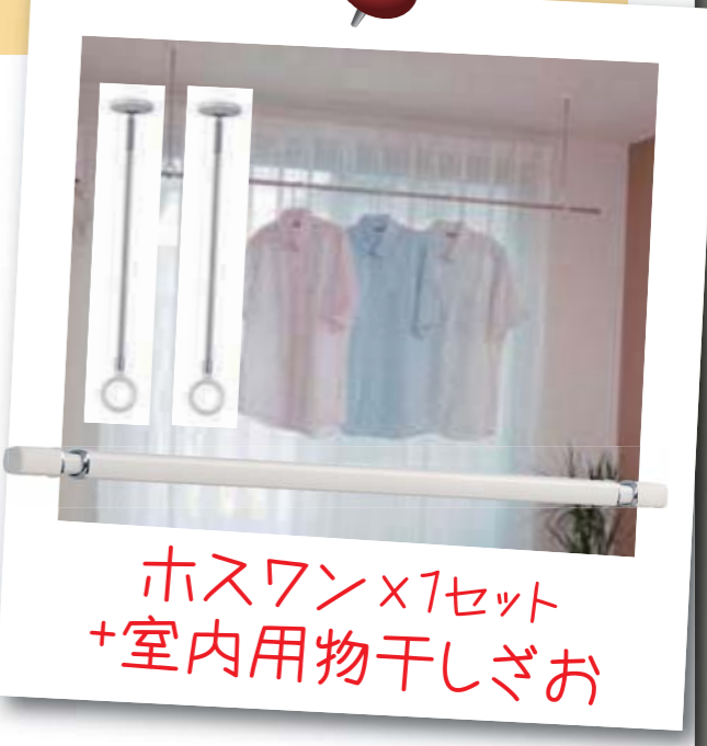
ホスワン×1セット +室内用物干しざお