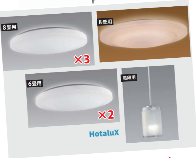
LED照明 フルセットA (ホタルクス製)

※カーテンレール+房掛けの追加は追加注文で承ります。 [1窓分追加は +4,950円(税込)]