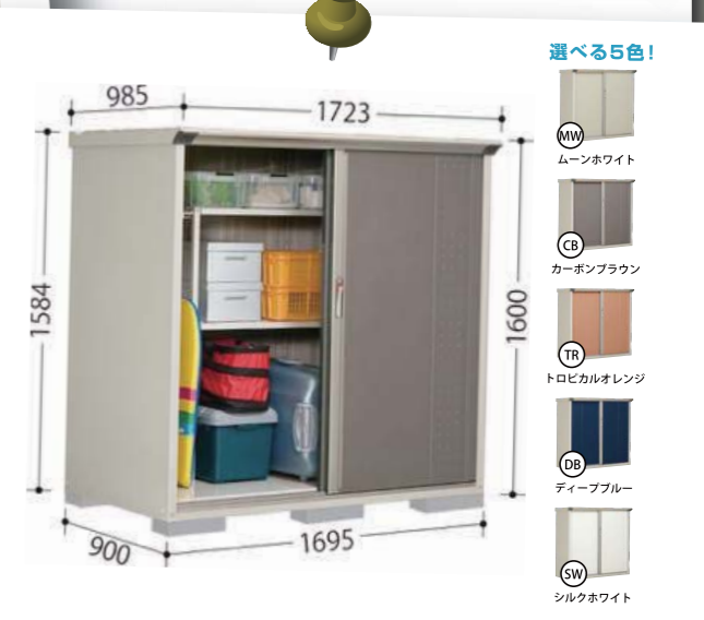
99ポ物置 小型物置 GP-179BF