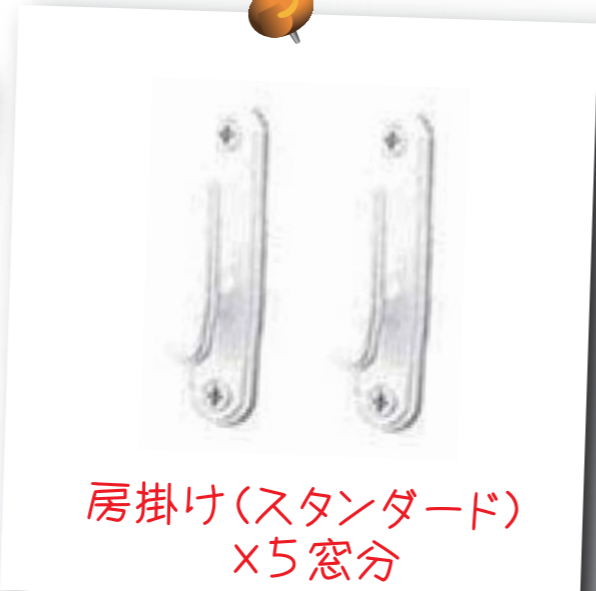
房掛け(スタンダード) ×5窓分