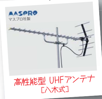
★TVアンテナ [八木式] 通常価格 ¥55,000 (税抜)