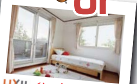
★オリジナル網戸一式 通常価格 ¥81,000 (税抜) 開く窓すべて ★オリジナル手動シャッター [テラス窓用・1Fのみ] ×2台 通常価格 ¥160,000 (税抜) / ¥80,000 (×2) または インプラス ×3台 [お好みの3ヶ所・要相談] 通常価格 テラス窓1台 ¥55,000 ~ ¥64,000 (税抜)、腰窓1台 ¥35,000 ~ ¥36,000 (税抜)