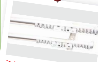
★カーテンレール ×7窓 通常価格 ¥27,000 (税抜)