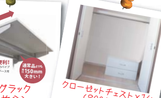
★ビッグラック (4枚分) 通常価格 ¥40,000 (税抜) ※この商品は、お客様にて組立・取付をお願いします。